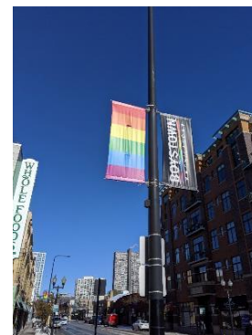
Center on Halsted (LGBTQの援助施設 高齢者住宅を含む)