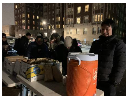
(低所得者・ホームレスの援助団体)