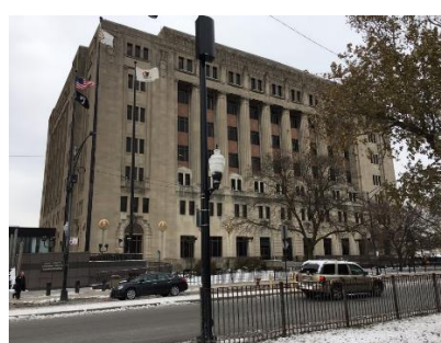
クック群(カウnty) 拘置所