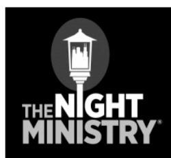
Night Ministry ナイトミニストリー