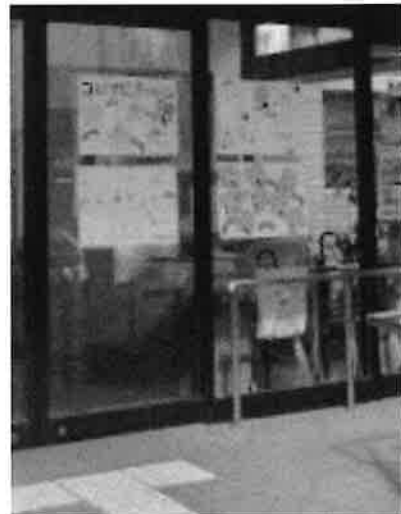
▲ 昨年度の取組み (施設協HP掲載)